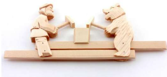
Рис.1. Образец игрушки «Кузнецы» (Богородская резьба)